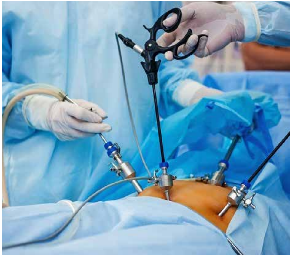
Ilustrasi alat operasi laparoskopi oleh dokter.