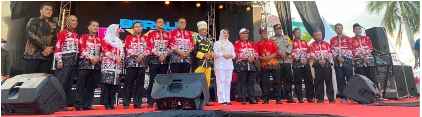
Foto: Suasana pembukaan Berau EXPO 2023.