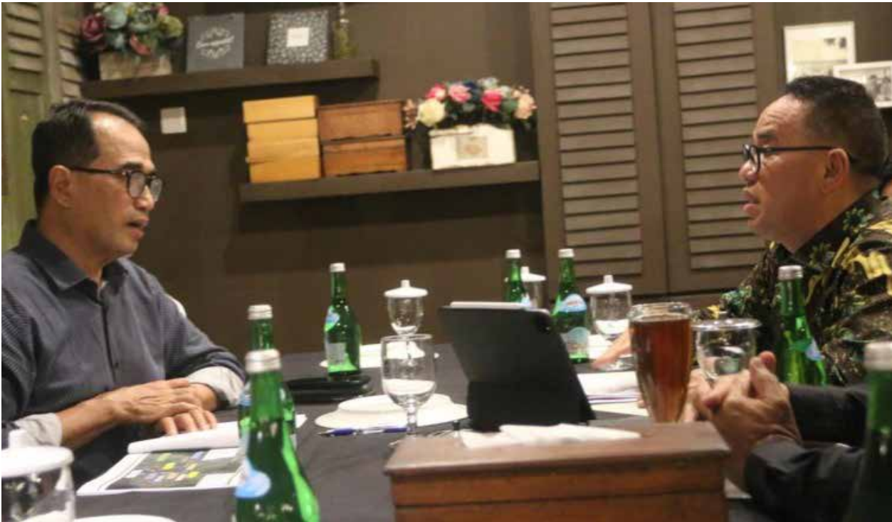
Pj Bupati PPU Makmur Marbun saat berdiskusi dengan Menhub Budi Karya Sumadi di Balikpapan, Selasa (31/10/2023).