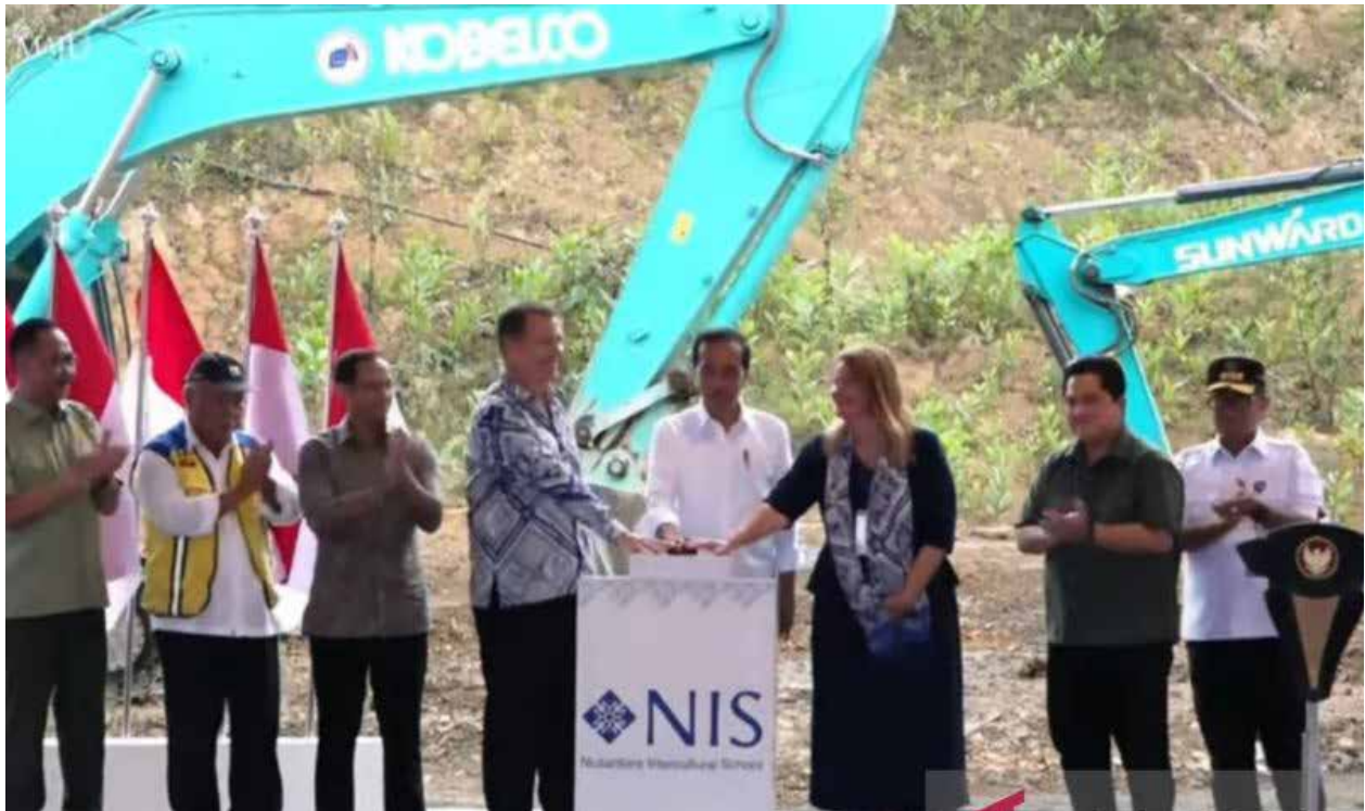
Presiden RI Joko Widodo meresmikan groundbreaking proyek sekolah internasional di kawasan IKN, Kalimantan Timur, seperti disaksikan dalam video dari Jakarta, Rabu (1/11/2023).