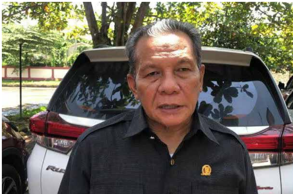
Ketua Komisi III DPRD Berau, Saga.