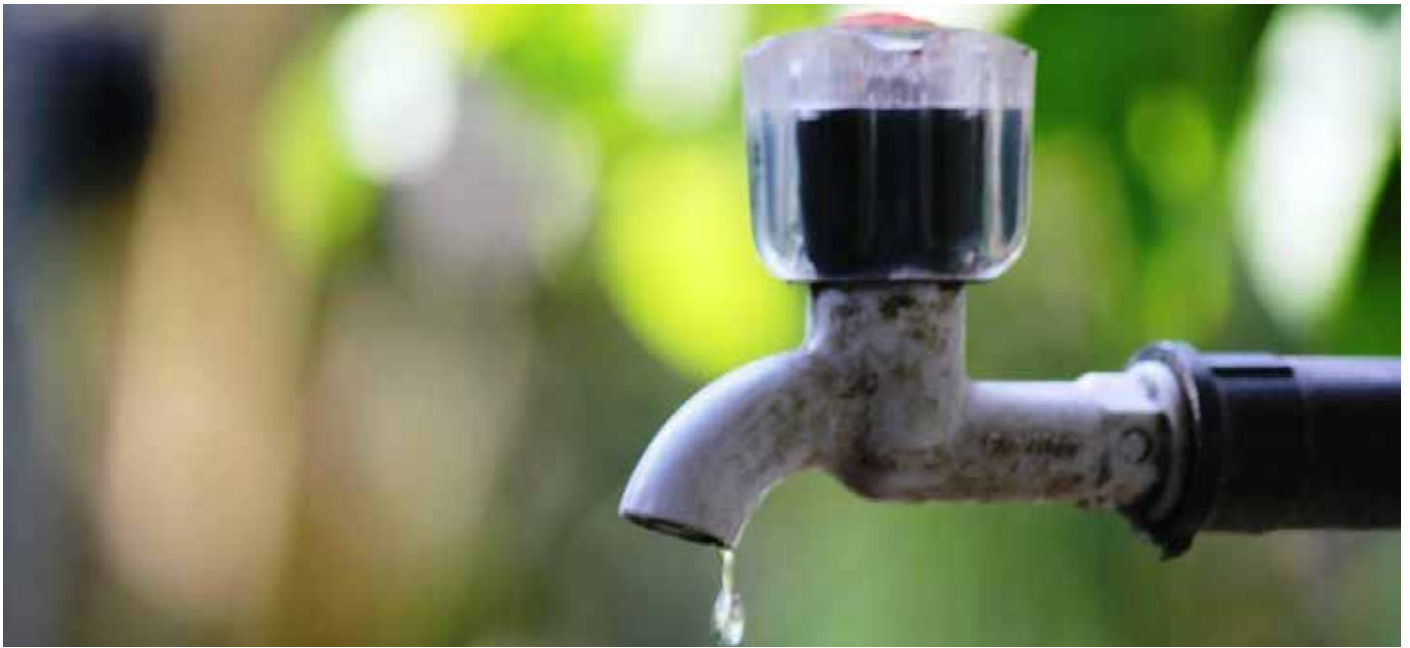
Ilustrasi Krisis Air (Kompas.com)