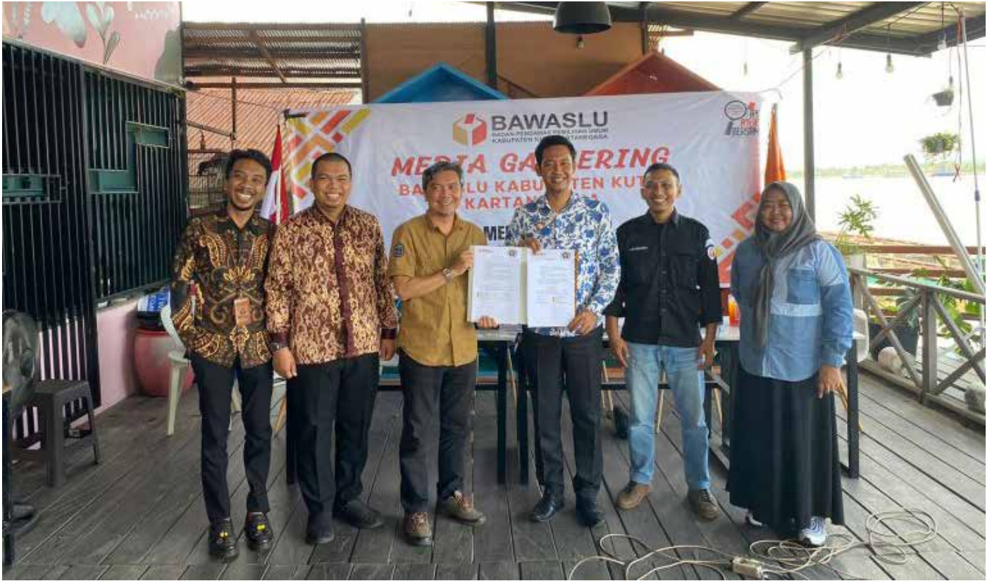
Suasana penandatanganan MoU antara Bawaslu Kukar dan PWI Kukar.