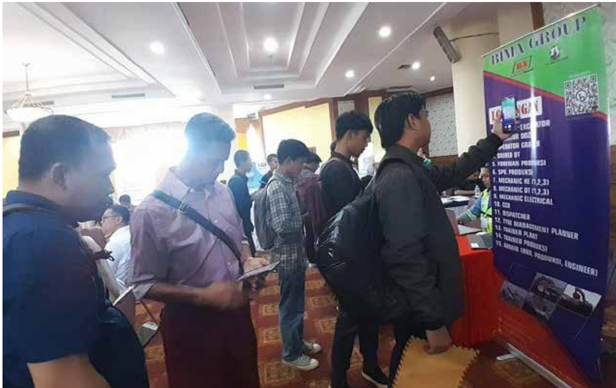
Suasana Job Fair 2023 yang digelar oleh Distransnaker Kukar.