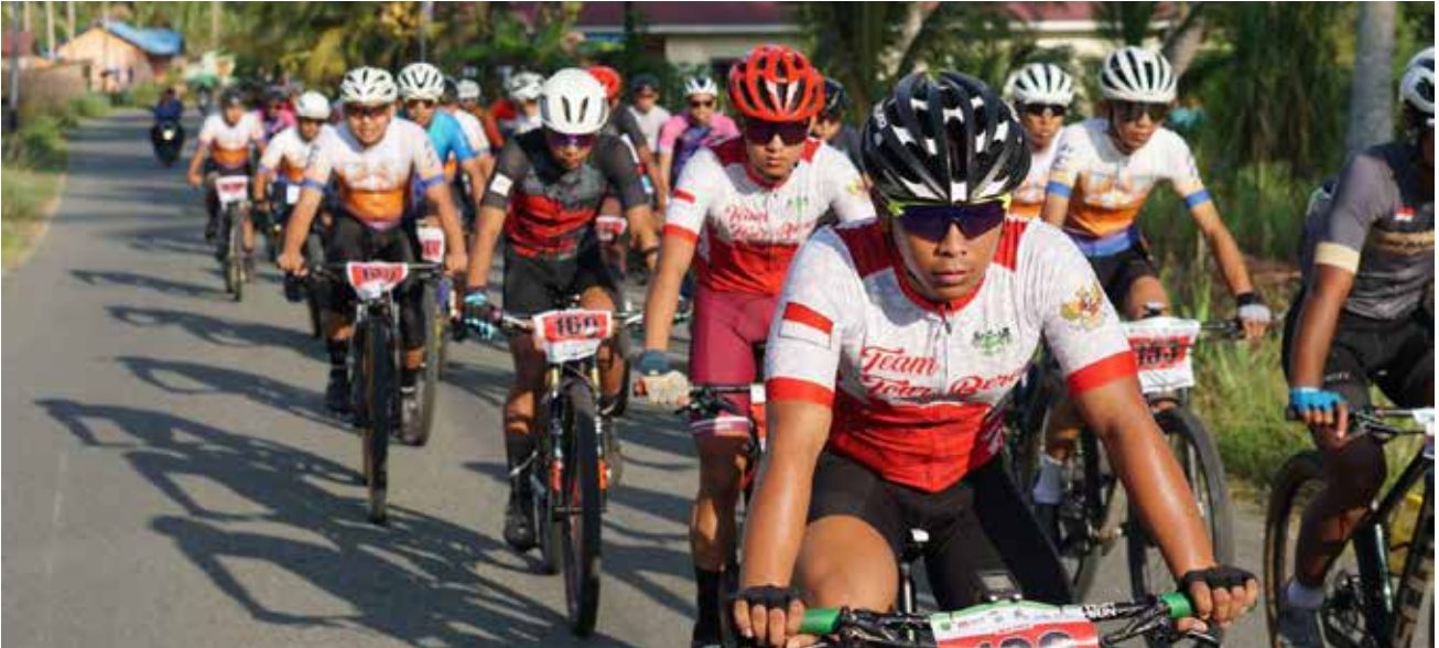
Para peserta Tour de Biduk-Biduk.