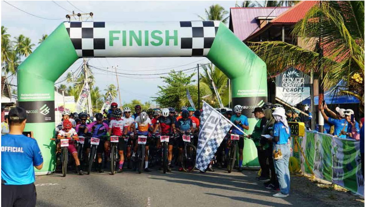
Suasana pagelaran Tour de Biduk-Biduk PT Berau Coal.