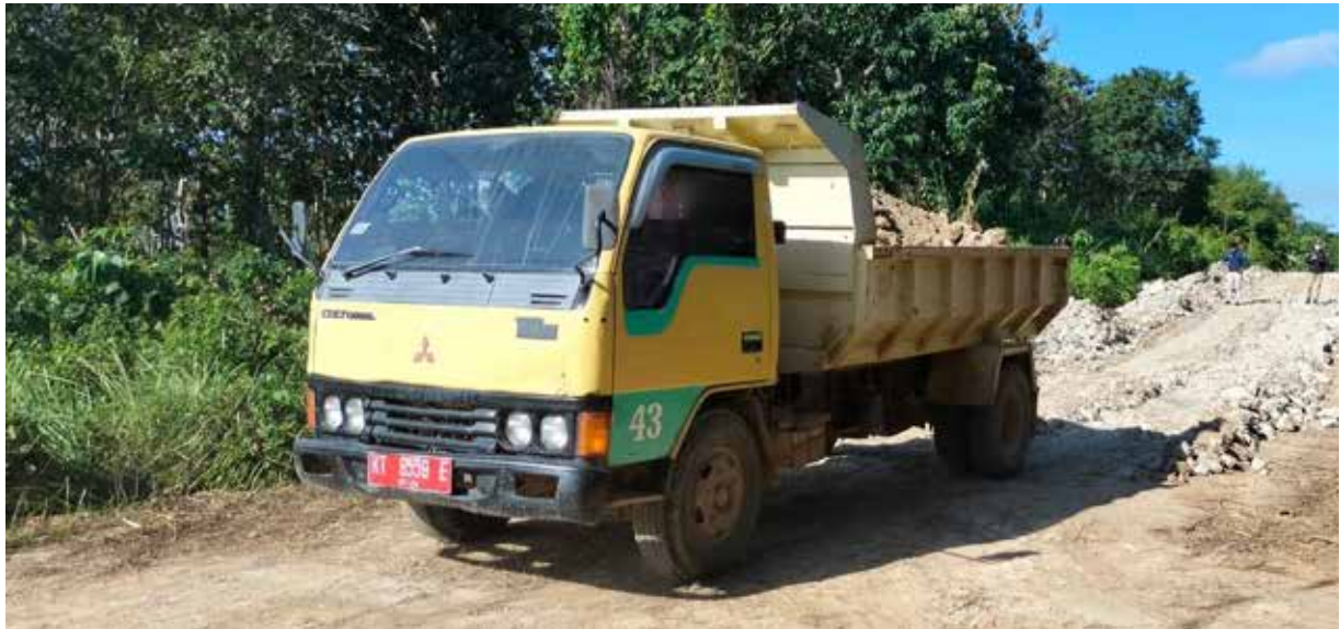
Peningkatan jalan di Kecamatan Tanjung Harapan