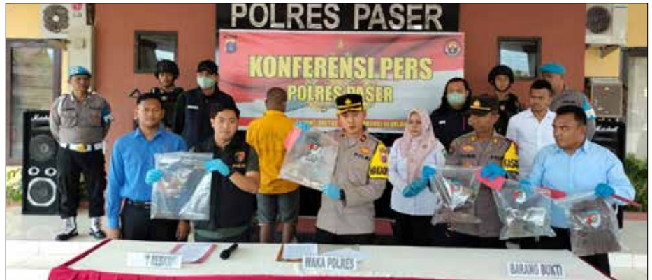
Konferensi pers di Polres Paser