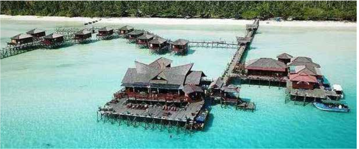
Kepulauan Derawan salah satu destinasi wisata yang berada di Kaltim