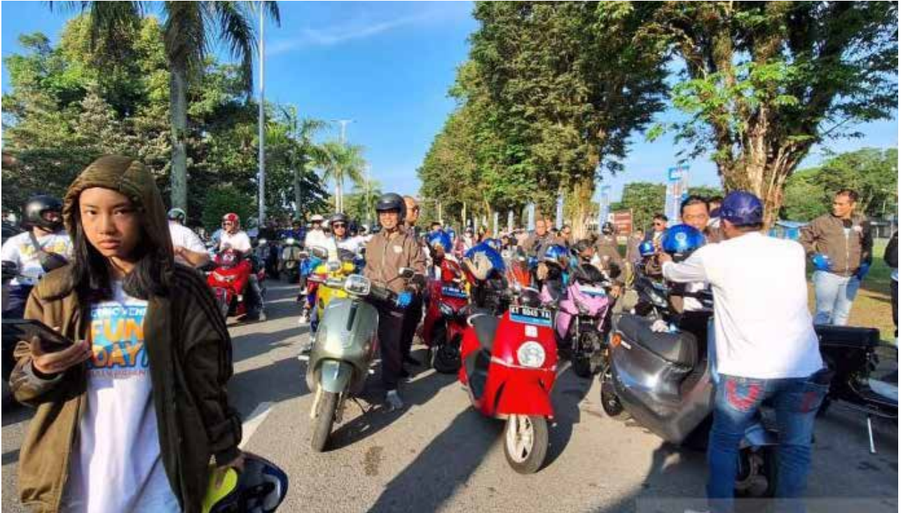
Para pemilik kendaraan listrik di Lapangan Merdeka, Balikpapan, Minggu 12/11/2023