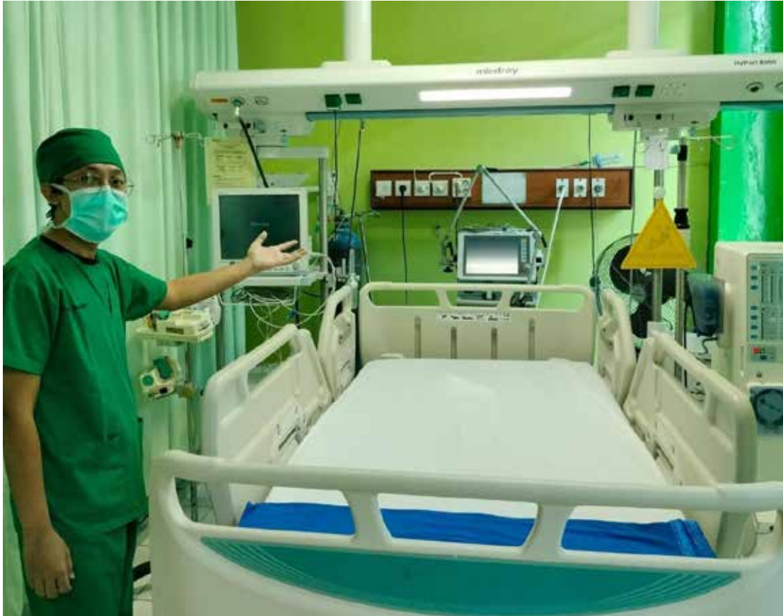
Ruang ICU RSUD Taman Husada Bontang. (Yahya Yabo)