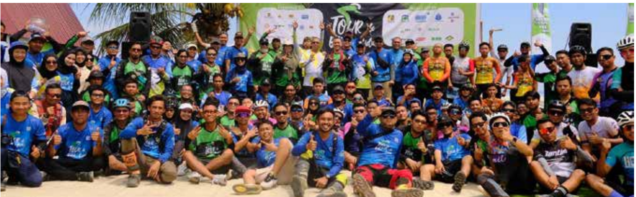
Foto bersama para peserta Tour de Biduk-Biduk.

si, dan mendukung event Tour de Biduk-Biduk yang digelar PT Berau Coal. Dengan harapan, kegiatan ini dapat dilaksanakan secara berkelanjutan dan lebih meriah.