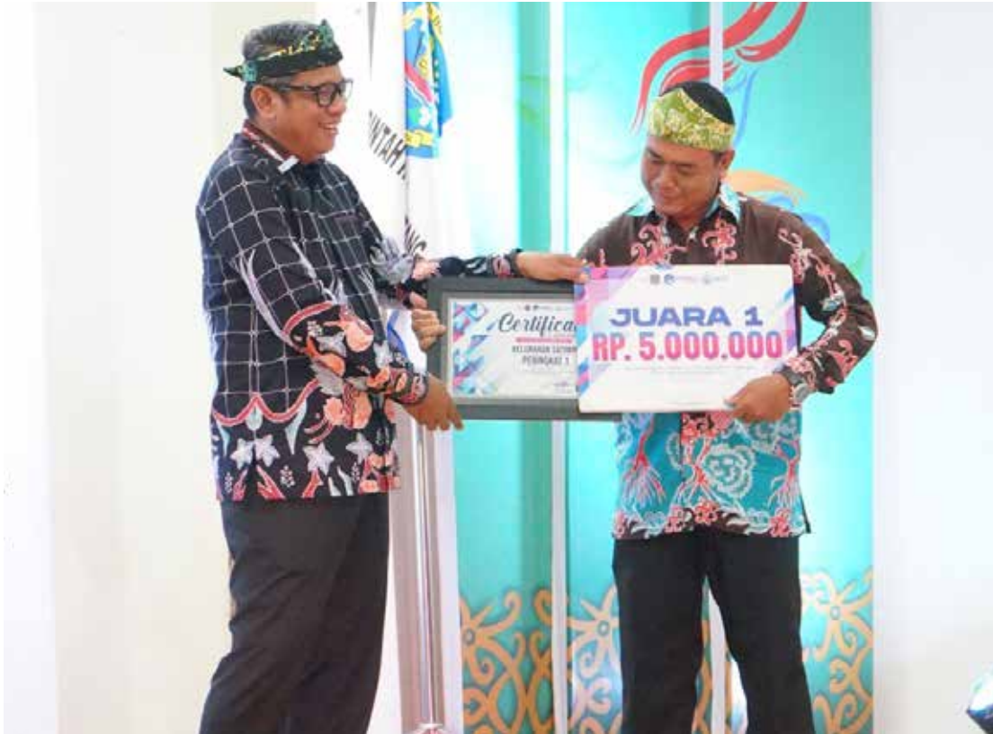
Motor untuk RT yang telah tiba di Kecamatan Bontang Selatan.