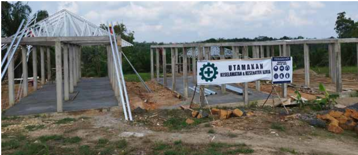
Lokasi pengerjaan rehabilitasi maupun bangunan baru untuk pasar.