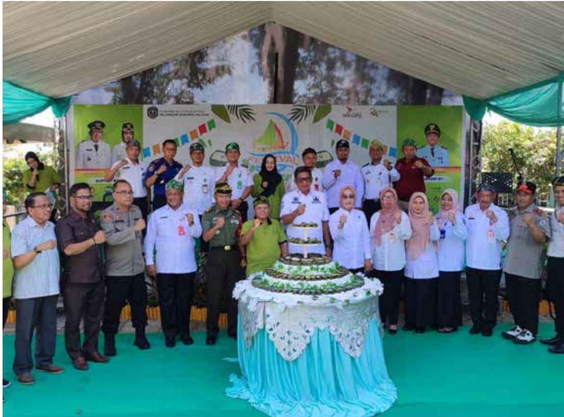
Kegiatan Festival Kuliner Kue Tetu 2023 di halaman Kantor Kecamatan Bontang Selatan.