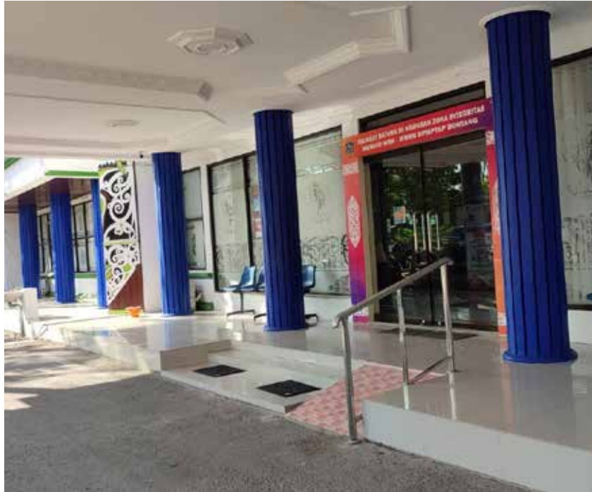
Jalur Disabilitas DPMPTSP Bontang.