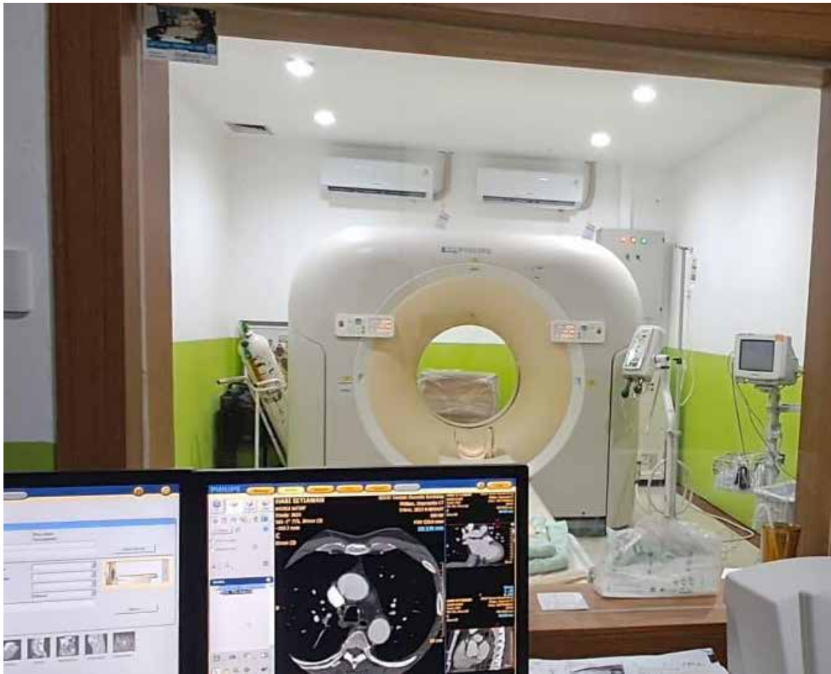
Alat CT Scan 128 Slices yang dimiliki RSUD Taman Husada Bontang. (Yahya Yabo)