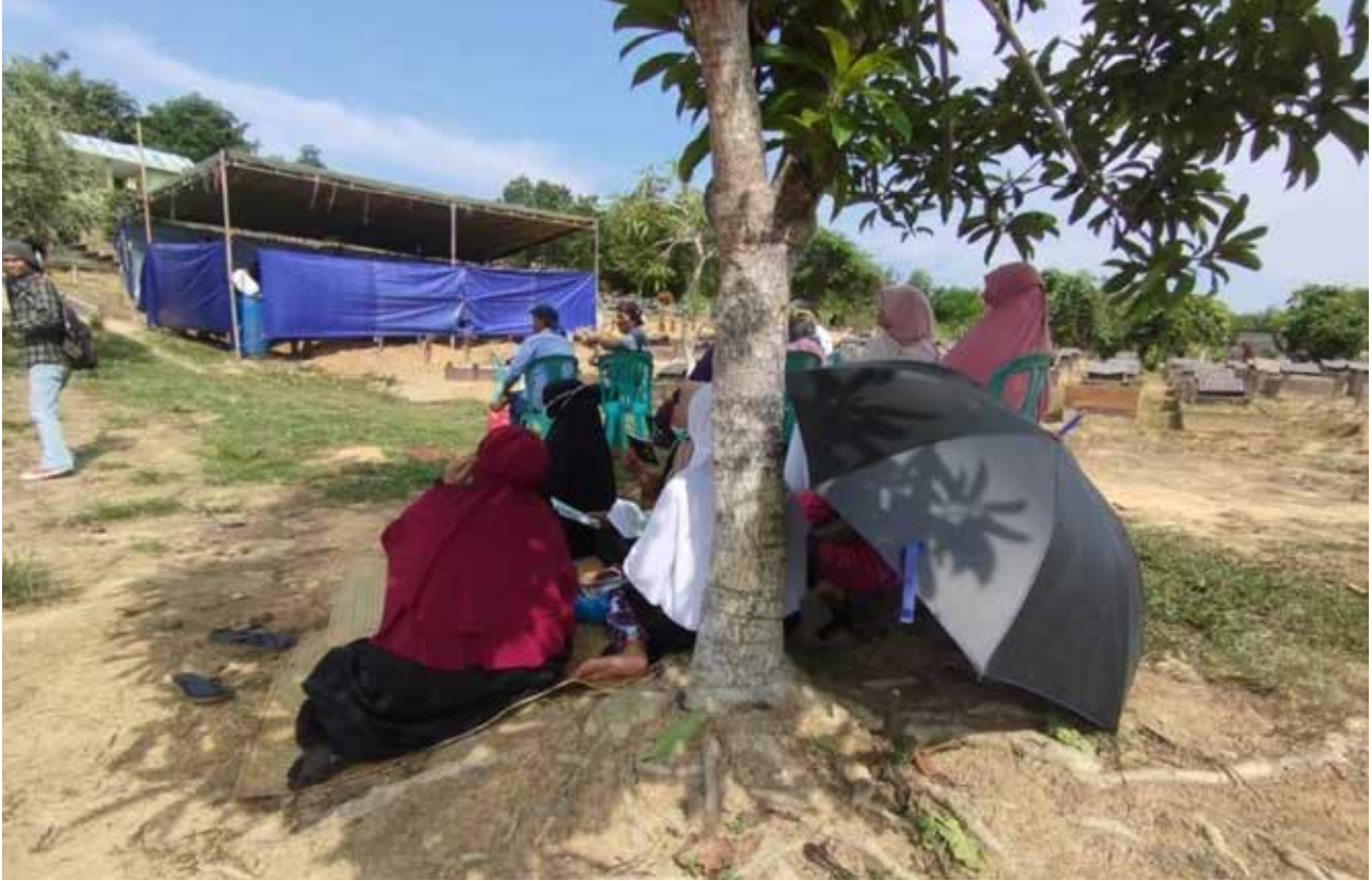
Polisi dan keluarga bongkar makam remaja putri DA (16) untuk otopsi, Selasa (14/11) di TPU Kelurahan Manggar Baru, Balikpapan Timur.