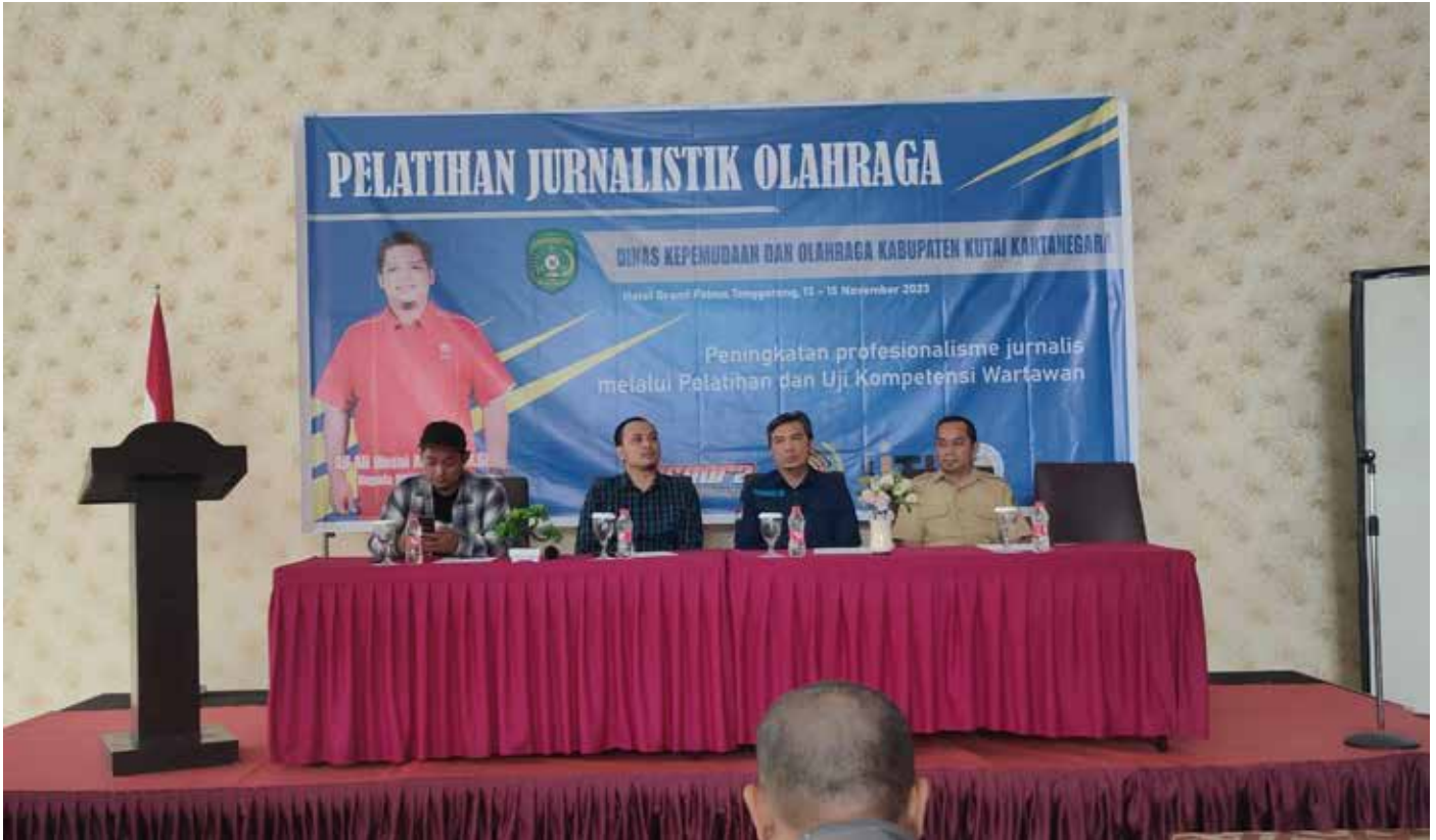
Proses pembukaan pelatihan jurnalistik keolahragaan dan Uji Kompetensi Wartawan (UKW).