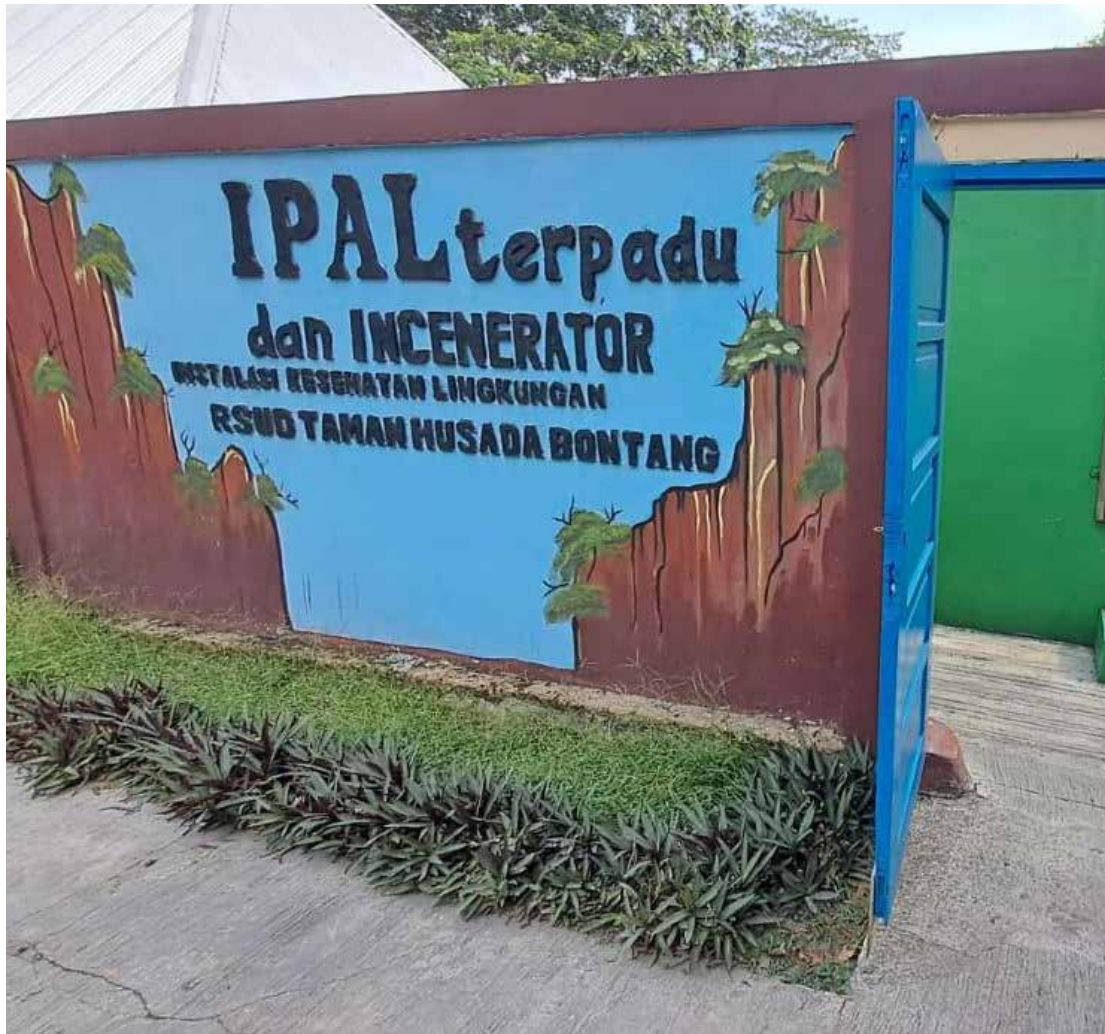
Incenerator yang dimiliki RSUD Taman Husada Bontang. (Yahya Yabo)