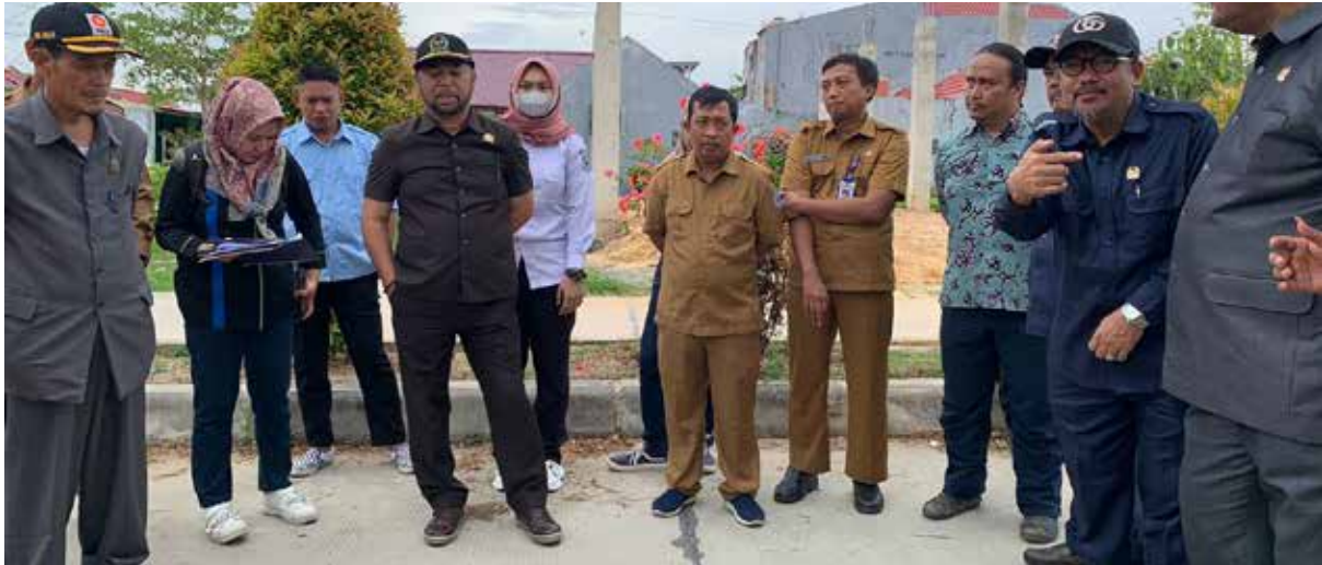
Rombongan Komisi III DPRD Bontang saat sidak di Perumahan Griya Wisata Bontang Kuala. (Dwi).