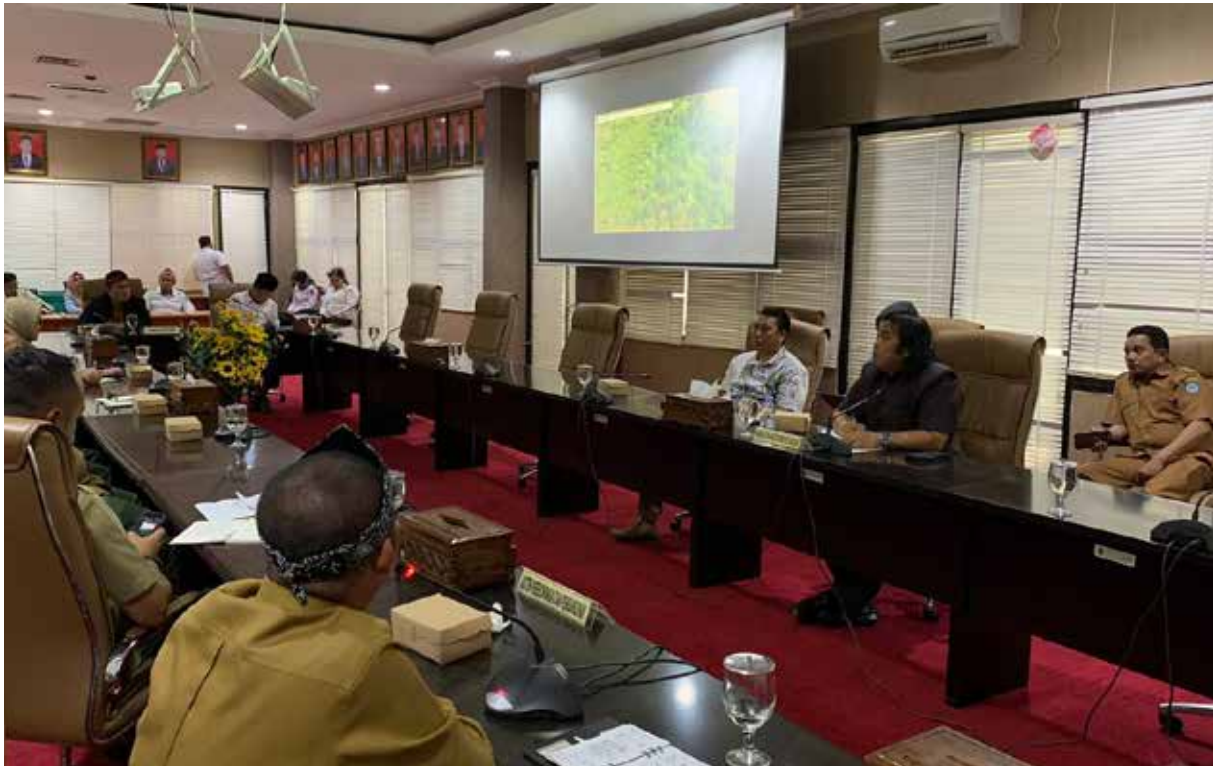
Wakil Ketua DPRD, Anggota Komisi I, beserta jajaran lainnya mengadakan rapat terkait Buaya Riska. (Dwi).