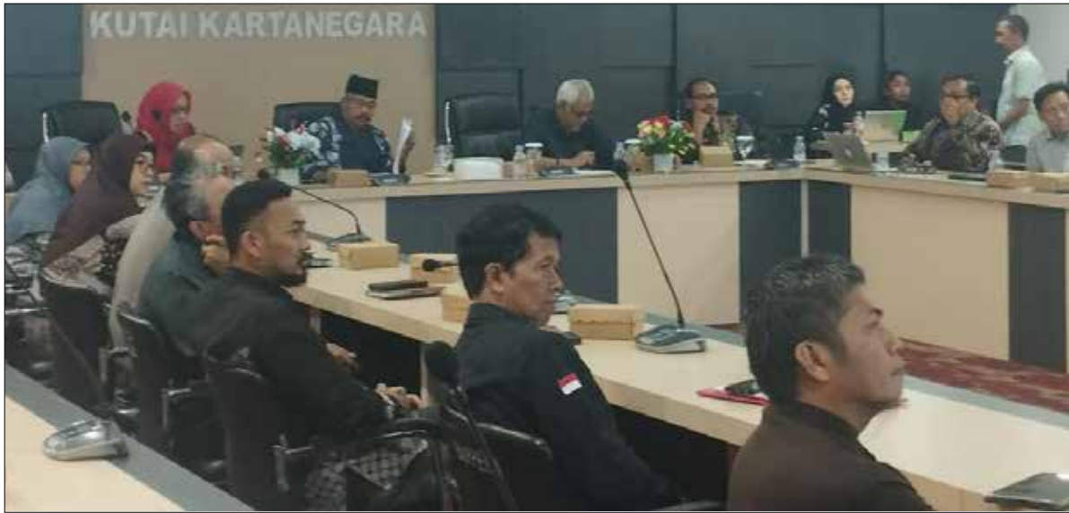
Suasana pertemuan Pemkab Kukar dengan Tim Ahli UGM.