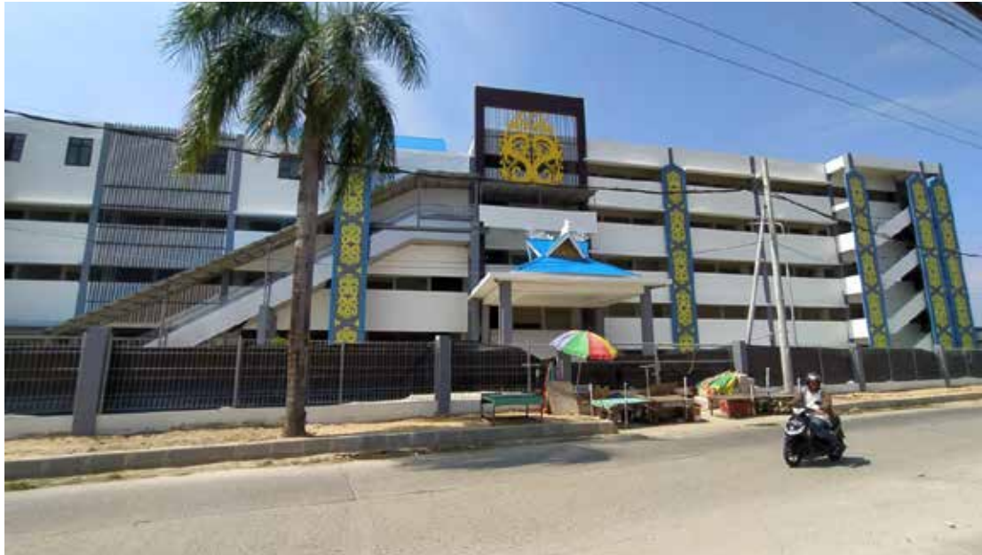
ILUSTRASI PASAR TAMRIN. (IST)