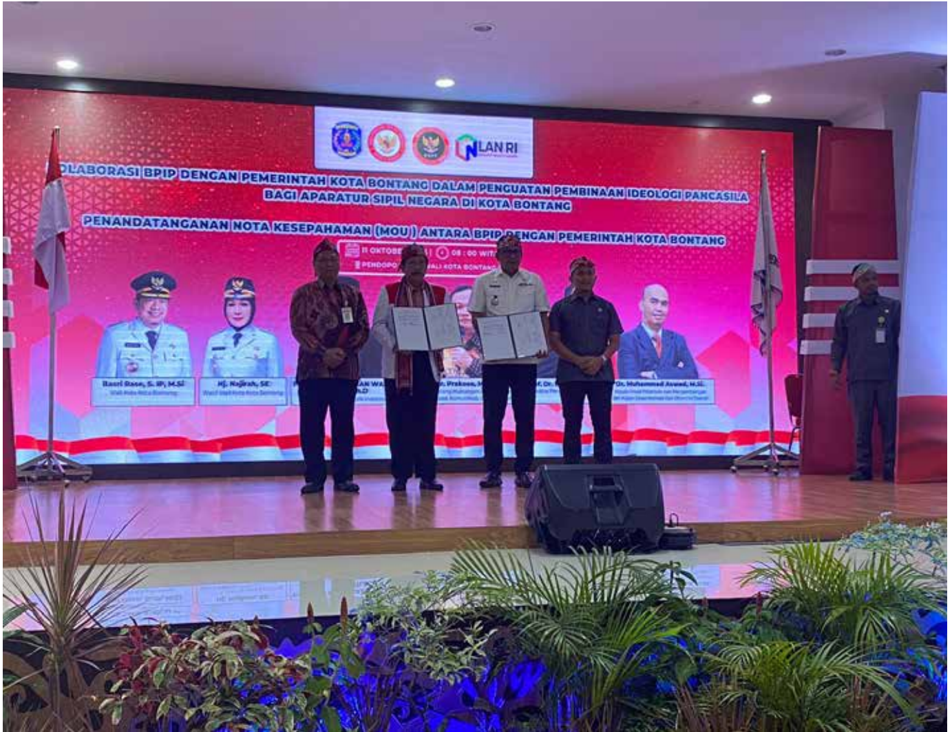
Penandatanganan MoU Pemkot dan BPIP.