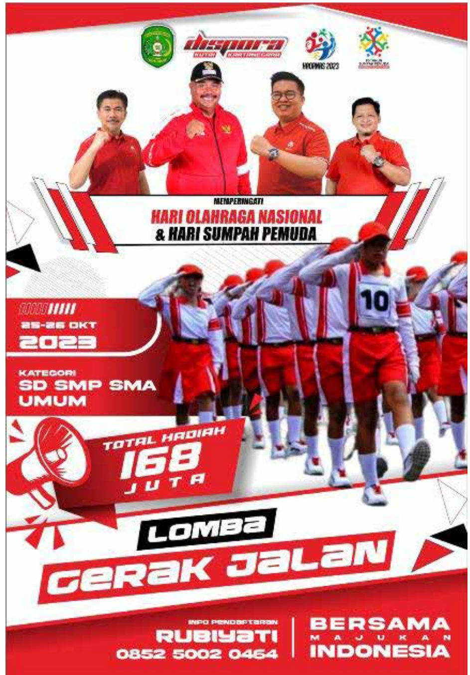
Poster lomba gerak jalan Dispورا Kukar.

Adapun, ketentuan lebih lanjut dan teknis akan dibahas pada saat manager meeting dan teknikal meeting, pada 23 Oktober 2023 pukul 10.00 WITA. Yang berlokasi di Kan-