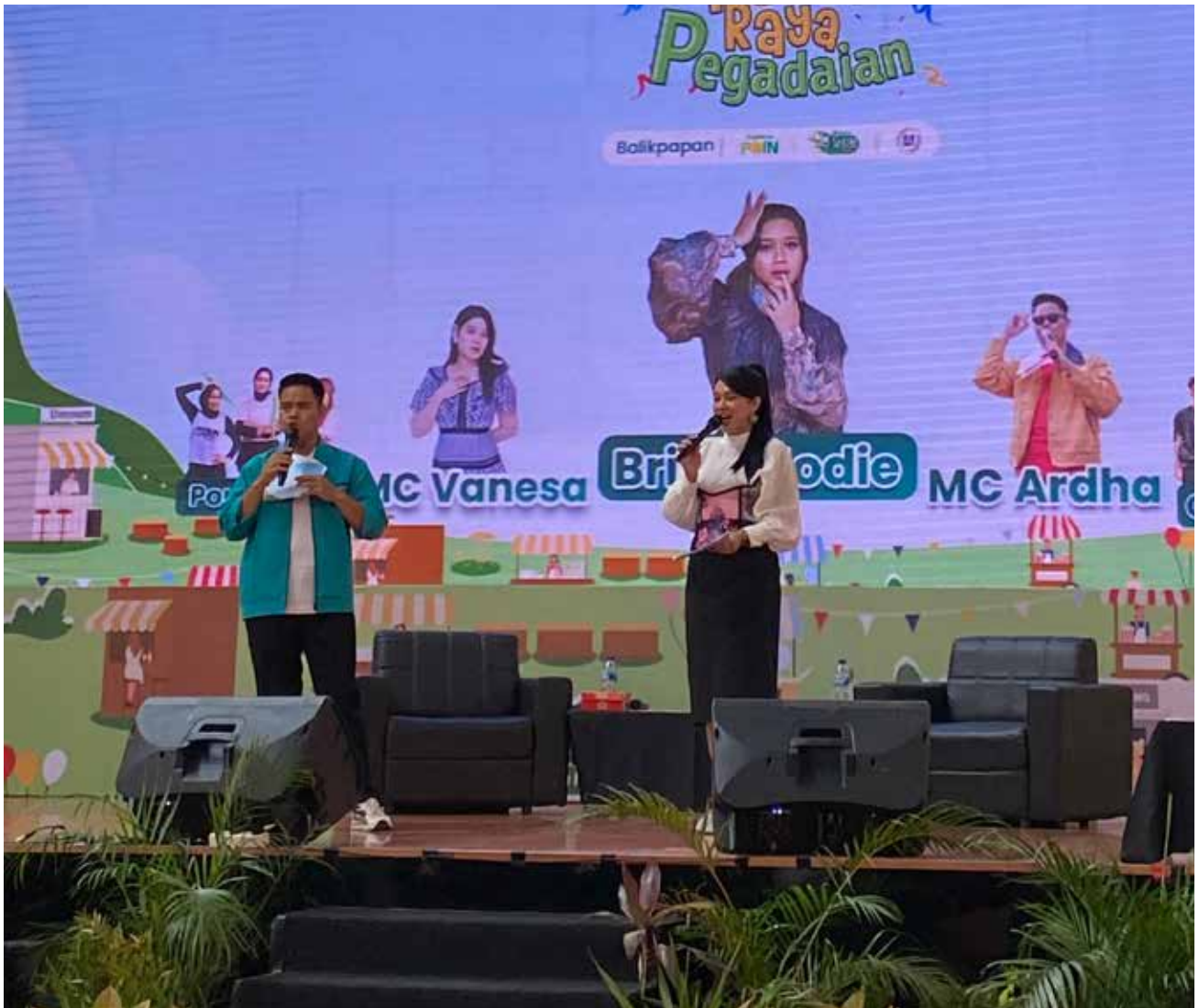
Pekan Raya Pegadaian di Bigmall Samarinda