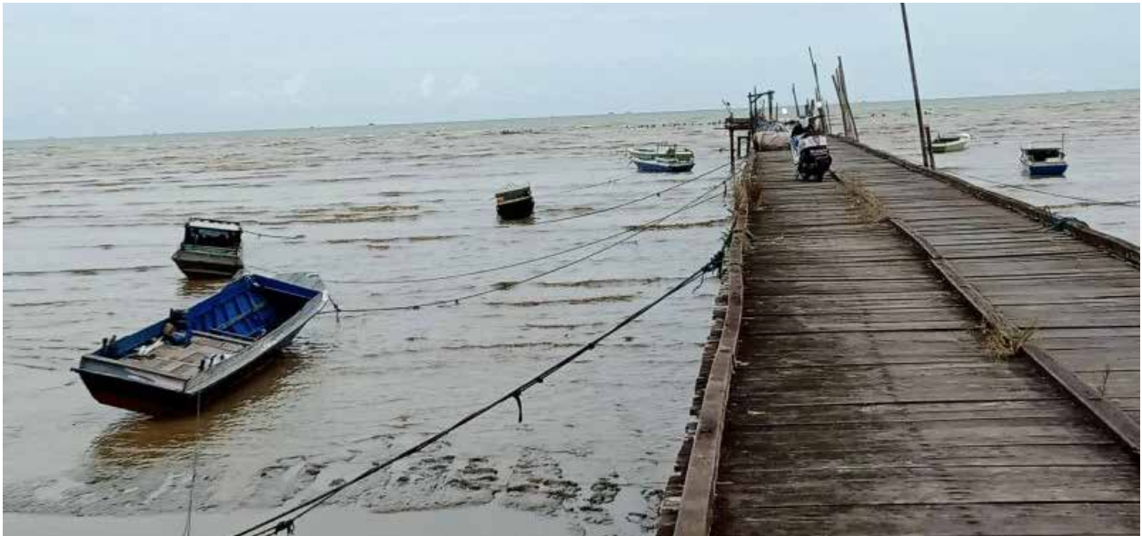
Perahu nelayan Kabupaten PPU sedang ditambatkan.