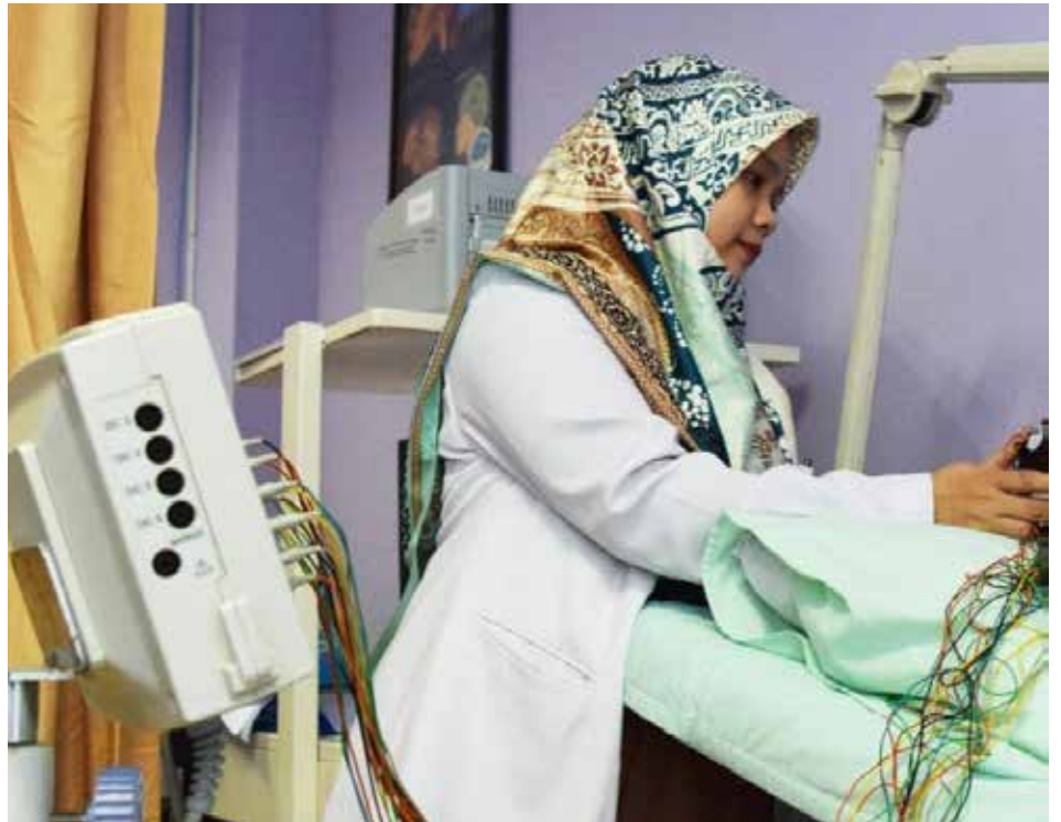
Dokter spesialis saraf atau neurologi saat memeriksakan pasien. (Yahya Yabo)

Selain itu, dr Atika menjelaskan, gejala stroke dapat terlihat berupa ganggu-