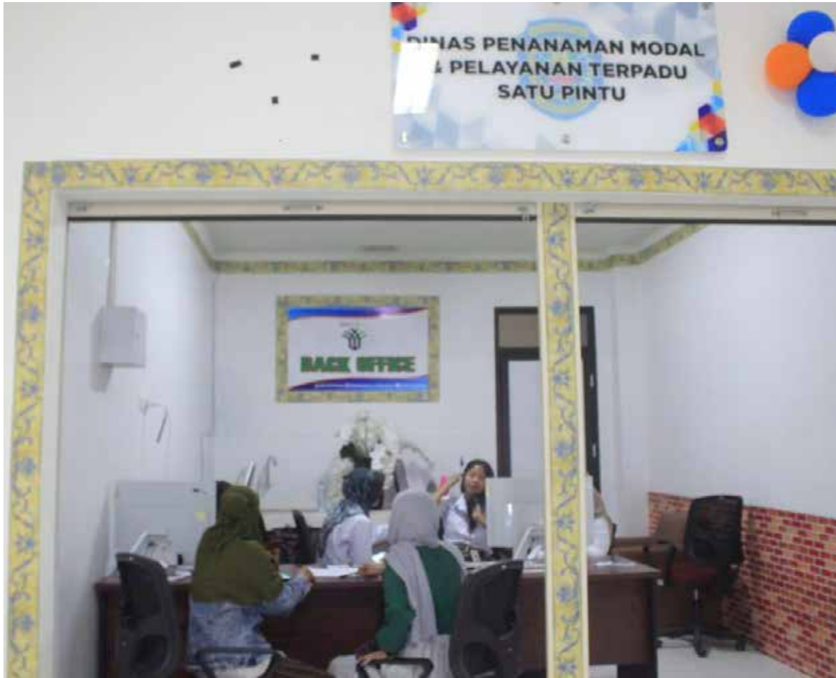
Outlet pelayanan DPMPTSP di Gedung MPP. (ist)