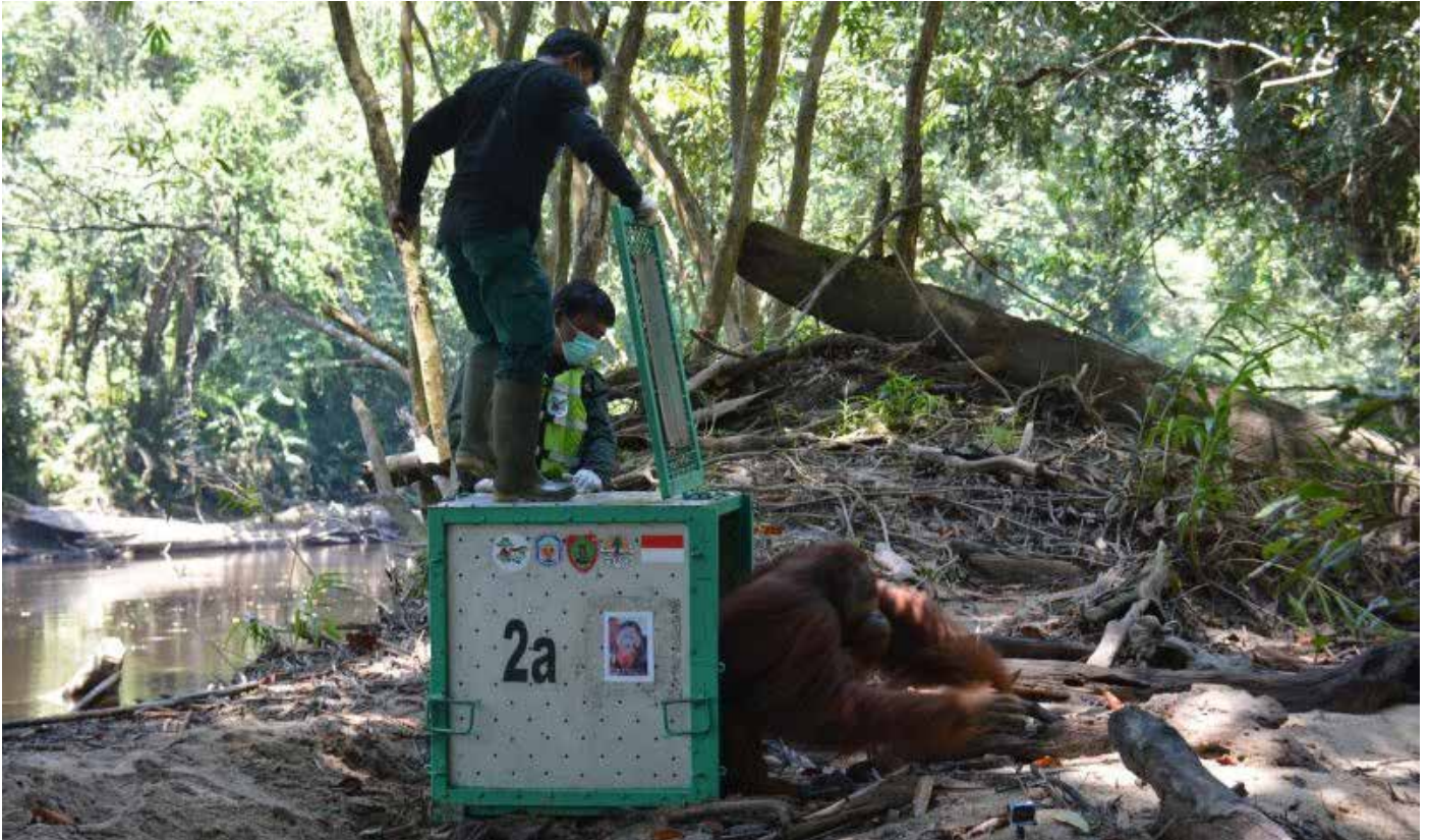
Petugas membuka pintu kandang dan melepaskan orangutan ke alam bebas di Hutan Kehje Sewen, Jumat 11 November 2023.